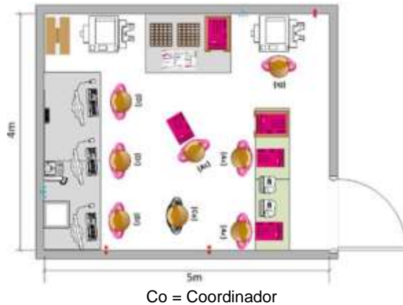
Ilustración 3 Ejemplo de distribución en los CCV